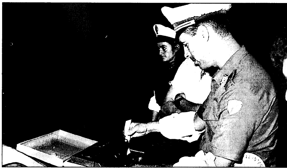
La Polizia stradale impegnata nei controlli di abuso di alcoolici.

fra quelli confermati dalla Polizia Stradale di Bergamo, può dare il polso della situazione: è che circa il 5 per cento degli incidenti è causato da persone che si mettono alla guida dopo aver bevuto.